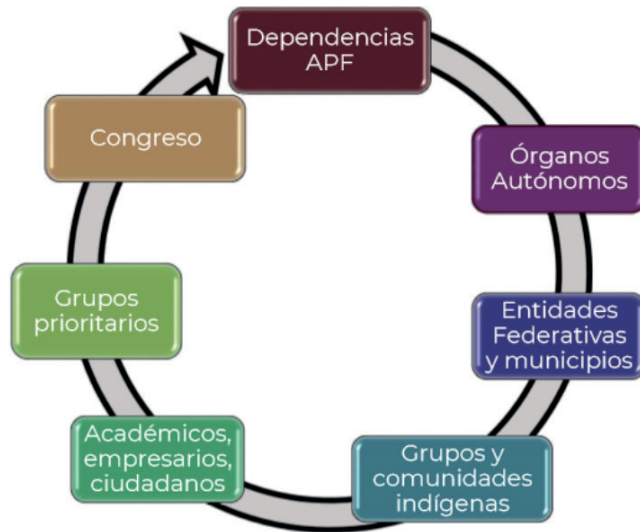
Imagen 1. Agentes que participan en la creación de PND